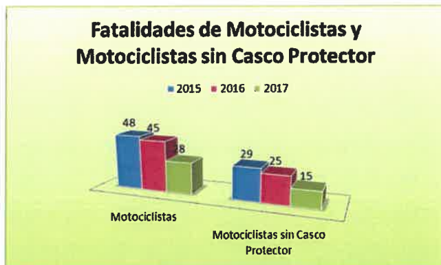
Gráfica III: Fatalidades de Motociclistas y Motociclistas sin Casco protector años 2015-2017

Entre las metas propuestas, estaba el disminuir las muertes de motociclistas en un 14 por ciento de 48 en 2015 a 41 para el 31 de diciembre de 2018. Este objetivo fue alcanzado; dado a que las muertes reportadas en el 2016 fueron de 45 y en 2017, 28. Los datos preliminares para 2018 informan un total de 38 muertes de motocicletas.